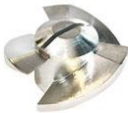
Rotor (Standard) Lägre tryck mer flöde