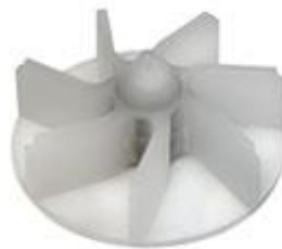
Impeller Högre tryck mindre flöde