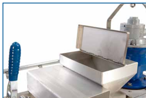
Anpassning för inblandning av pulver, polymer eller vätska