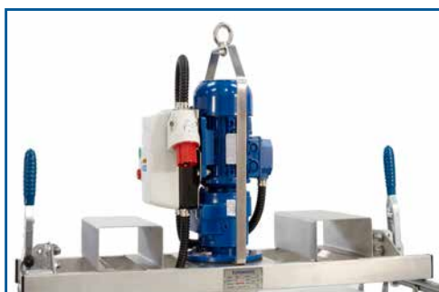
Anpassning för lyft med gaffeltruck