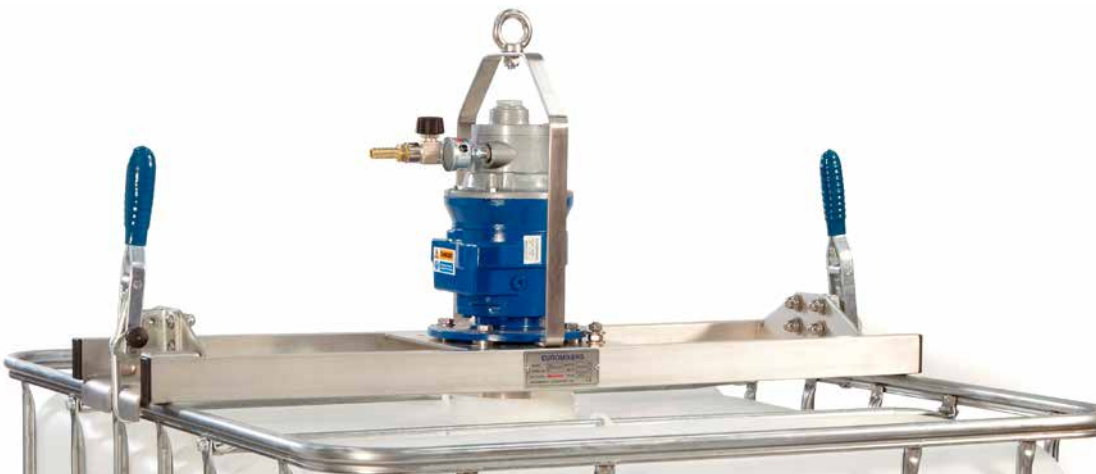
Omrörare med luftmotor

Omröraren drivs med en elektrisk eller pneumatisk motor monterad på en lättviktsbalk i stål. Enheten monteras enkelt över IBC tanken och låses fast med snabbblåsande klämmor. En integrerad säkerhetsbrytare förhindrar att omröraren startas innan den är korrekt monterad på en IBC tank.