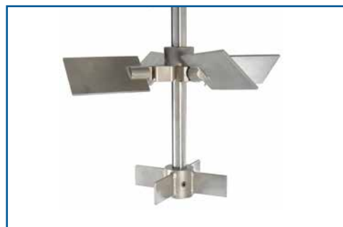
Extra impeller för omrörning vid låg vätskenivå