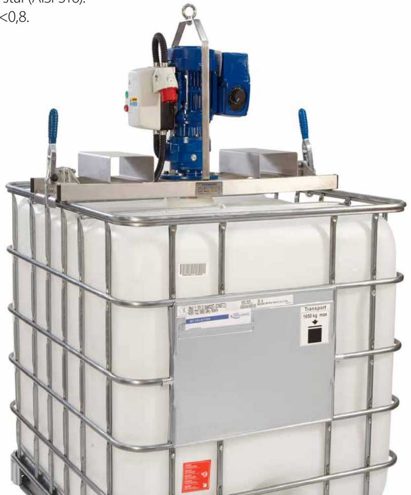
Omrörare utrustad med fästen för gaffeltruck och frekvensstyrning